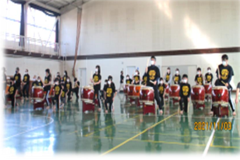
全国児童館みやぎ大会で演奏