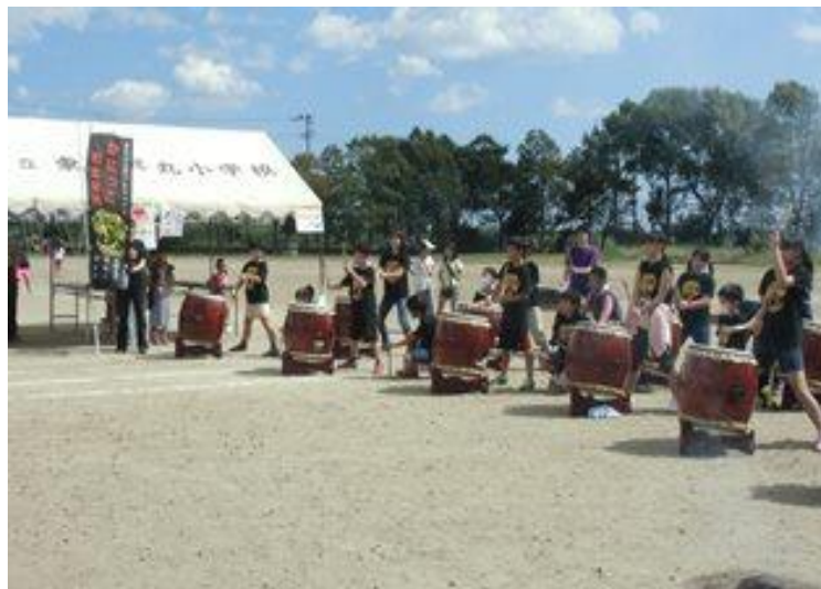
東四郎丸小PTAバザー

— 一家庭も学校も地域もつながろう — オリジナル曲：紡ぐ（震災の記録を和太鼓で紡ぐ）