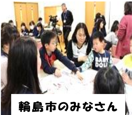
輪島市のみなさん