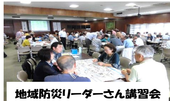
地域防災リーダーさん講習会