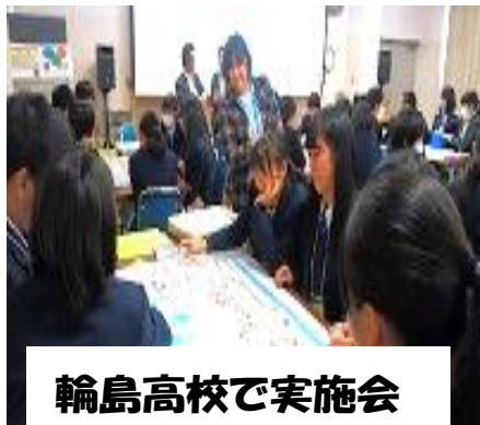
輪島高校で実施会