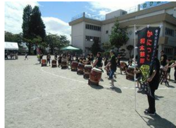
四郎丸小ふれあいフェスティバル