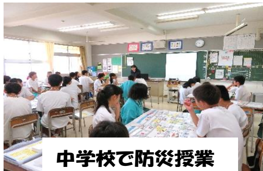
中学校で防災授業